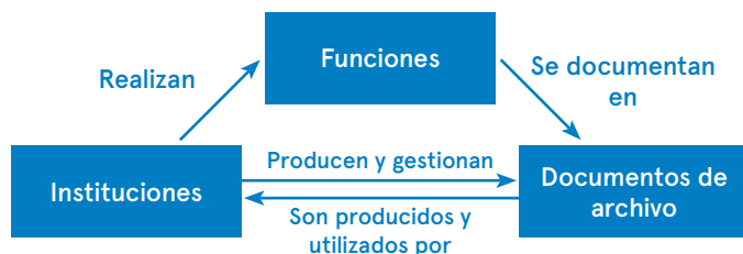
Cuadro 3. Relación entre las instituciones, las funciones y los documentos de archivo (ICA, 2007, p. 37)

En el marco de esta norma, el término función alude a “Cualquier objetivo de alto nivel, responsabilidad o tarea asignada a una institución por la legislación, política o mandato. Las funciones pueden dividirse en conjuntos de operaciones coordinadas como subfunciones, procesos, actividades, tareas o acciones ( Function )” (ICA, 2007, p. 10). 15